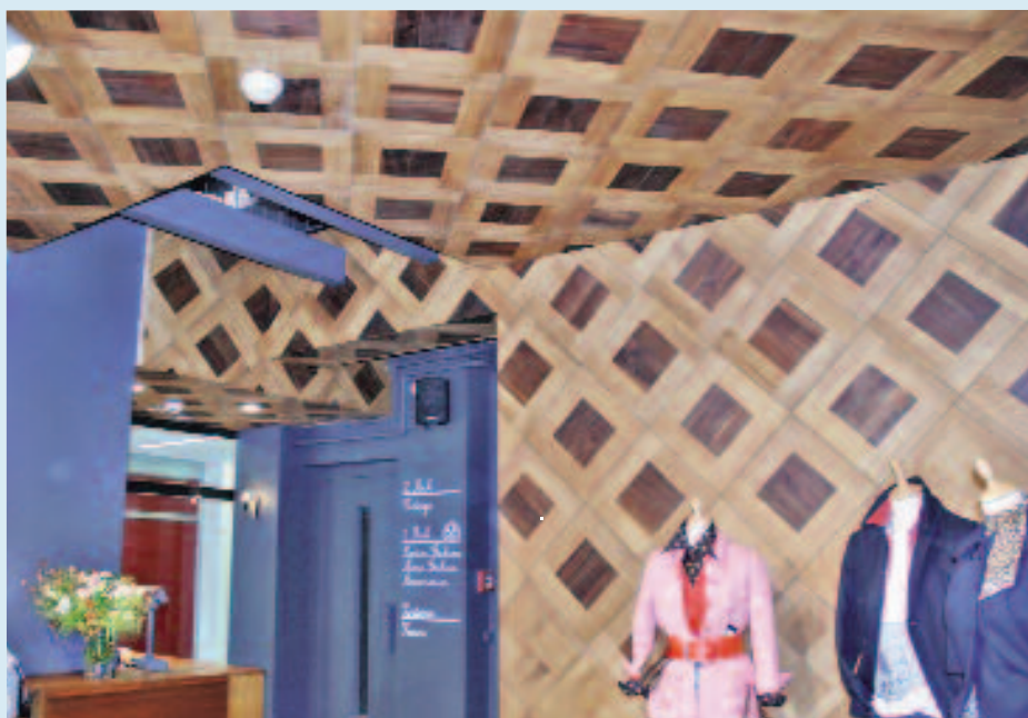
Der fertige Laden: Über 1.300 Arbeitsstunden brauchte es insgesamt, um das Parkett auszubauen, aufzufrischen und in den Geschäftsräumen wieder einzubauen.