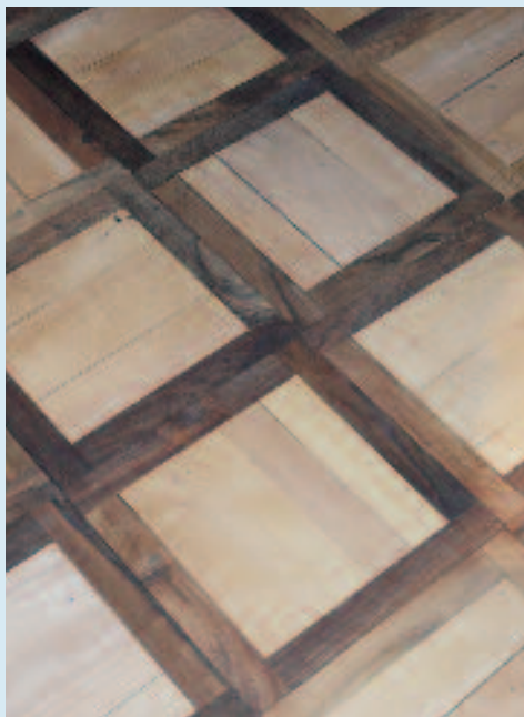
Die verschiedenen Parkettarten scheinen wie miteinander verwoben.